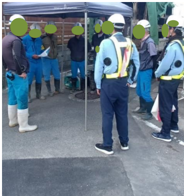
【再発防止安全訓練及び空調服の着用】